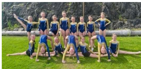
Turnerinnen der Kategorie K3

Mit Velofahren und Bräteln in der Zübersrüti im Kernwald schlossen wir unser Geräteriegen-Jahr vor den Sommerferien mit der ganzen Riege ab. Das Wetter hat es gut gemeint mit uns. Die Mädchen genossen die Umgebung rund um die Grillstelle und entdeckten dabei so einiges. Anschliessend verabschiedeten wir die Mädchen in die wohlverdienten Sommerferien!