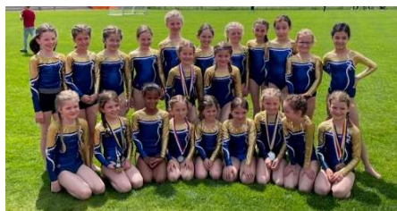
Turnerinnen K1 und K2

Wir zeigten unser turnerisches Können an zwei Wettkämpfen. Am 6. Mai 2023 starteten wir mit 54 Turnerinnen an der Regionenmeisterschaft Pilatus/Obwaldner Meisterschaft in der Dossenhalle in Kerns. Am 24. Juni 2023 reisten 23 Turnerinnen begleitet von ihren Eltern nach Hünenberg. Dort fand der 26. GETU-Cup der Sport Union Schweiz statt. Da einige unserer Leiter*Innen gleichentags am Turnfest teilnahmen, hatten wir einen akuten Leiterengpass und waren angewiesen auf die Unterstützung der Eltern. Die von uns angefragten Eltern übernahmen alle spontan einen Betreuungseinsatz. Insgesamt neun Auszeichnungen durften wir an diesem Wettkampf entgegennehmen.